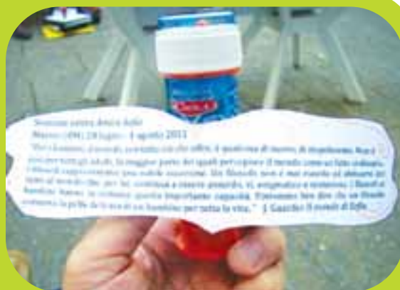
Sessione estiva Amica Sofia “Bolle di sapone” Il mondo di Sofia J. Gaarder Marino 29 luglio 2011

hanno in comune questa importante capacità. Potremmo ben dire che un filosofo conserva la pelle delicata di un bambino per tutta la vita.” 1