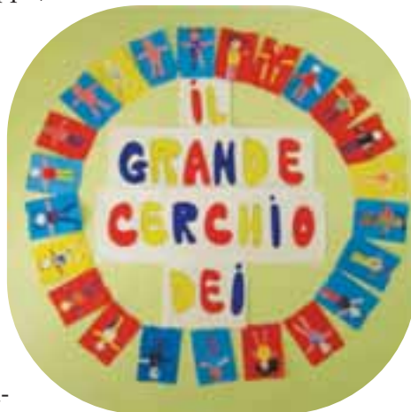
Il grande cerchio luogo d'incontro e scambio

Una mattina di novembre, dopo l'estrazione del Cresci Cresci 5 , S., una bimba di quattro anni, chiede ai compagni di ricevere l'energia della bellezza. Dopo un momento di silenzio per lo stupore di tutti, lei spiega: la bellezza la voglio per fare tutto bello e più buono . Restare in si-