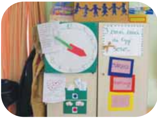
I Cresci Cresci del giorno

si differenziano i giorni e le relative esperienze, ma tutto il contesto viene reso unico. Nell'unicità della situazione che si vive è allora possibile far diventare colui o colei che devi incontrare unico/a.