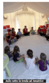
Asilo sotto la tenda ad Amatrice

Innocenzina Rossi" di Spoleto. L'immobile è stato dichiarato inagibile in seguito ai danni procurati dal terremoto. In questa situazione di emergenza i bambini sono stati ospitati presso i locali di una scuola comunale vicina. La sistemazione tattiva è provvisoria e ha portato non pochi disagi per il trasloco che in questi giorni si sta facendo. Nelle prossime settimane i tecnici dovranno valutare i reali danni e quindi i tempi e i modi di ripristino dell'agibilità della scuola. Comunque sicuramente saranno lunghi e onerosi. E dunque è doveroso ragionare su una soluzione a medio lungo termine. Alla scuola, ai bambini, alle educatrici, a tutto il personale, ai genitori, alla comunità il nostro sostegno.